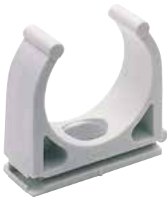
Clip fissatubo aperto FT, colore: grigio RAL 7035