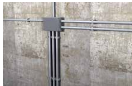
Fissaggio tubi in PVC